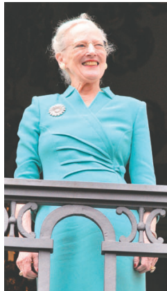
Dronningen måtte træde alene ud på balkonen, da hendes mand, prinsgemalen, på grund af sygdom ikke kunne deltage.

Torsdag den 16. april, valfartede folk i Nordsjælland op bagved Fredensborg Slot til morgenvækning af Regentparret i anledningen af dronningens fødselsdag, da Fredensborg Slot i år er dronningens residensslot af hensyn til renoveringen af palæet i København.