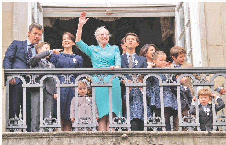
Tre gange trådte dronningen ud på balkonen. Anden gang fulgte hele kongefamilien med ud samme balkon. Dronningen samlet med sine to sønner, svigerdøtre og alle otte børnebørn.