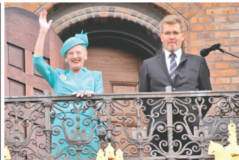
Københavns overborgmester Frank Jensen udråbte fra balkonen ud til Rådhuspladsen et nifoldigt leve for dronningen.

Godt klokken to trådte dronningen ud på Rådhusets balkon, ud mod Rådhuspladsen, og modtog folket's hyldest. Københavns