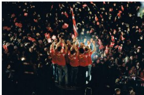
Udenfor Rådhuset på Rådhuspladsen hyldede godt 30.000 håndboldfans de hjemvendte guldvindere fra EM, der fandt sted i Norge, januar 2008. OL og VM billetter sikret.

På grund af EM titlen til Danmark sikrede herrelandsholdet sig direkte adgang til OL i Beijing til august og VM i Kroatien 2009. Det er 41 år siden sidst, et dansk herrelandshold var i en finale. I 1967 vandt Danmark sølvmedaljer.