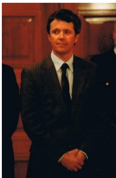
Kronprins Frederik modtog EM-heltene på Københavns Rådhus 28. januar 2008.