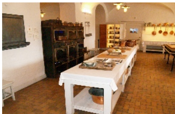
Siden 2003 har hele kongehusets samling af kobbertøj været samlet i Festkøkkenet under Christiansborg Slot, og det giver en helt særlig stemning til stedet.