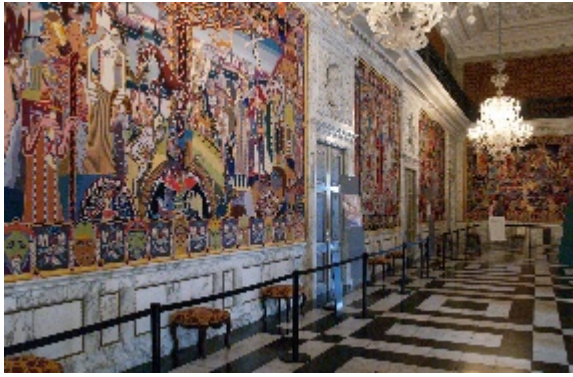
Riddersalen anvendes ved de store gallamiddage, en del af nytårskurene og de kongelige aftenselskaber. På de helt store festdage kan der dækkes op til omkring 400 gæster.