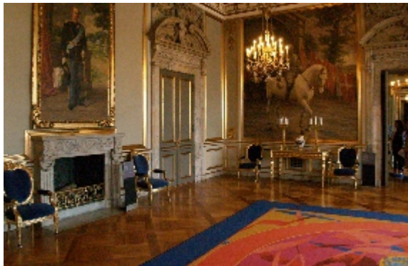
Christians 9's Gemak Den farvestrålende sal med sofaer, gulvtæppe og kamin benyttes blandt andet ved ambassadørmødtager, hvor Dronningen kan konversere ambassadørerne efter de officielle taler og håndtryk i Tronsalen.