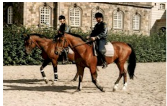
Københavns Politi, der i dag igen, anvender heste i tjenesten, har deres heste opstaldet i De Kongelige Stalde på Christiansborg. På ridebanen trænes hoffets og politiets heste dagligt.