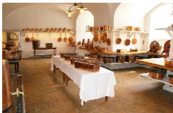
Festkøkkenets store samling af kobberkøkkentøj anvendes ikke længere. Køkkenet er indehaver af godt 2 tons køkkenudstyr i kobber.