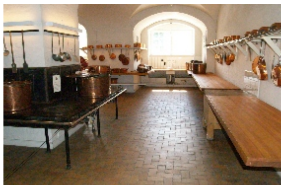
Hvorfor køkkenting af kobber? Kobber er en god varmeleder, der giver en hurtig og ensartet opvarmning af maden. Kobber var ikke prestigefyldt eller kostbart. Med udviklingen indenfor køkkenudstyr blev kobbertøjet dog efterhånden skiftet ud med mere moderne typer.