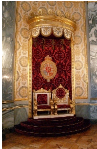
Tronsalen Tronstolene her blev reddet ud fra det andet Christiansborg under slotsbranden i 1884.