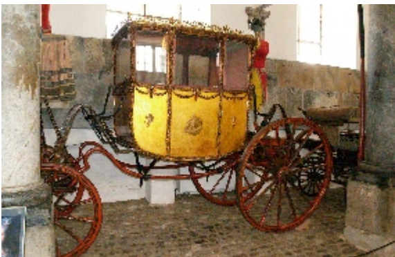
Staldens længste og ældste karet er enkedronning Juliane Maries statskaret fra 1778. Hun var kong Christian 7.s stedmor. Den gamle karet kræver otte heste spændt for vognen i prægtigt gallaseletøj.

I dag er der kun 20 heste tilbage i staldene. De anvendes når dronningen holder nytårskure og andre store fester på Christiansborg Slot, hvor de smukke hvide heste spændes for Guldkaretet i prægtigt gallaseletøj og kører Majestæten fra Amalienborg til Christiansborg. Gardehusarerne er på besøg i stalden med deres heste og udstyr, hver gang de skal eskortere regenten i karet til og fra slottet. Guldkaretet bygget i 1840 kaldes også "Kong Christian VIII's karet". Det polstrede interiør i karetten har plads til to personer.