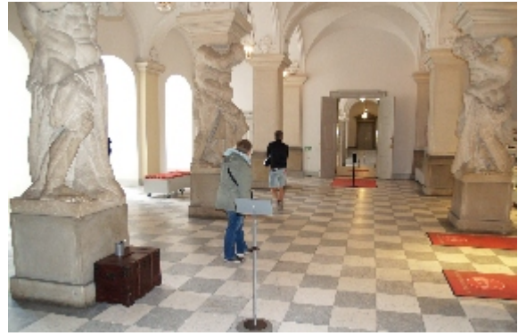
Drabantsalen her er indgangssal til De Kongelige Repræsentationslokaler, hvor gæsterne ankommer og afleverer deres overtøj, inden de går ind til audienslokalerne eller op ad Kongetrappen og ind i salene på første sal. Pressen har adgang til Drabantsalen, hvor de fotograferer de gallaklædte værter og gæster.