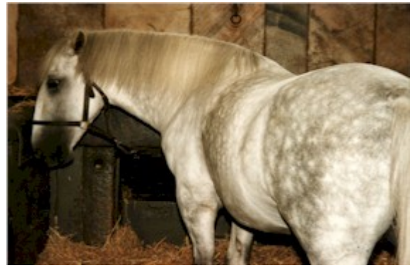
I De Kongelige Stalde på Christiansborg Slot er i dag opstaldet færre heste end tidligere, derfor rummer staldene også de kongelige kareter.