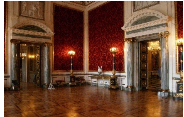
Fløjls gemakket Ved de store fester på slottet, står kongefamilien på række i det imponerende Fløjls gemak og byder alle gæsterne velkommen, inden de fortsætter in i den festpyntede Riddersal. Det er de lysende røde fløjlstapeter med det danske rigsvåben, der har givet gemakkets dets navn.

Tronsalen er traditionelt set den vigtigste og fornemmeste sal på et slot. Det er kulminationen på den lange række af gemakker af stigende betydning og pragt. Den ovale sal regnes også for et af de smukkeste interiører med de dobbelt-vævede silketæpper, søjlepilastrene i grøn, græsk marmor og en kopi af Thorvaldsens Alexanderfrise.