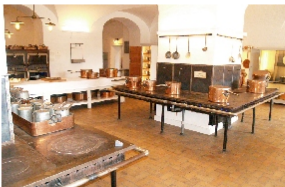
Det Kongelige Festkøkken under Christiansborg Slot anvendes i dag kun som anrettekøkken. Afslutningen af de kongelige retter fra Amalienborg Slotskøkken anrettes her i køkkenet og sendes op med køkkenelevatorerne til de festpyntede sale.

I blomsterrummet var der et væld af dufte, når de mange farverige blomsteropsatser blev fremstillet. Det rum anvendes stadig, når dronningens blomsterdekoratører arrangerer blomster til de store fester.