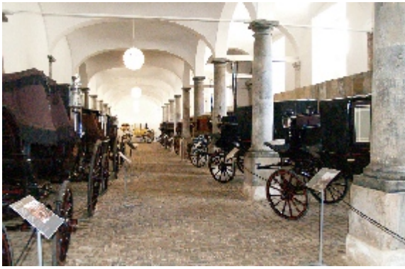
De Kongelige Stalde rummer ud over hestene et karetmuseum med en samling af de historiske kongelige kareter og vogne, der stadig anvendes ved de officielle begivenheder.