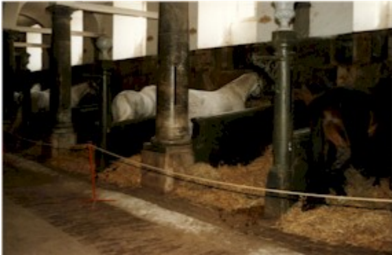
I staldene er der i dag opstaldet omkring 20 heste. Alle heste fra De Kongelige Stalde er fra medio juni til medio august på græs.