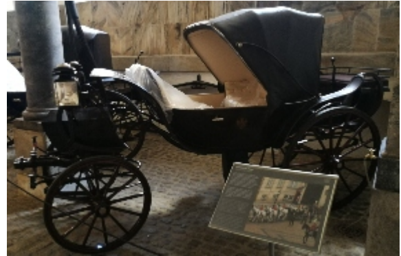
Den sorte gallakaret, bryllupskaret, er en barouche fra 1906. Regentparret benyttede den, da de blev gift i 1967.

Det var den samme karet, kronprinsparret benyttede, da de efter vielsen i 2004 kørte gennem København og hilste på befolkningen.