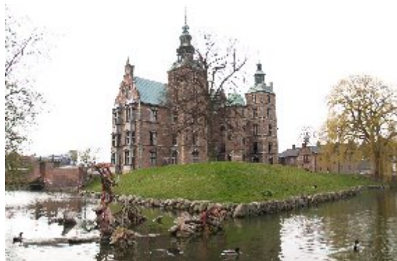
Kong Christian IX's 400 år gamle slot, Rosenborg Slot er nu igen åbnet for offentligheden.