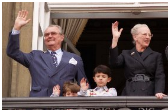
Regentparret stod på balkonen med deres to første børnebørn prins Nikolai og prins Felix. Dronning Margrethe og prinsgemal Henrik har i dag fire børnebørn.