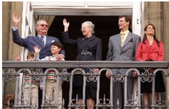
Marie stjal hele billedet fra dagens fødselar, dronning Margrethe, da hun trådte frem.

Midt på eftermiddagen, klokken halv tre, deltog dronning Margrethe i genåbningen af Rosenborg Slot, der igen var klar til at modtage de mange besøgende, efter et restaureringsarbejde på godt et år var færdig. Restaureringen af slottet var den mest omfattende i mere end 130 år. Blandt andet har riddersalen fået et nyt marmorgulv. Mere end 30 millioner kroner har det store omfattende restaurering af Rosenborg Slot kostet. Mon ikke genåbningen af slottet, på fødselsdagen, var en gave til dronningen. Det var dronningens eget ønske, at gobelinerne i 1999 skulle bringes tilbage fra Christiansborg Slot til Rosenborg Slot. På den måde har hun haft en finger med i spillet for, at riddersalen nu har det harmoniske og historiske udtryk, som ses i dag. Så også på den måde var det en ære, at hun kom som æresgæst, ved genåbningen af Rosenborg Slot.