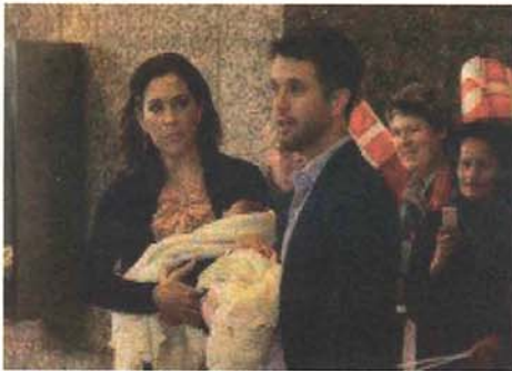
Sådan så det ud, da Per Brungsgård fangede de syv dage gamle kongelige tvillinger i fredags.