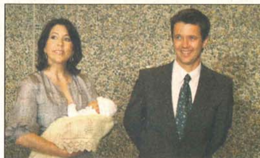
Per Brunsgårds billede af Mary og Frederik og den lille ny.