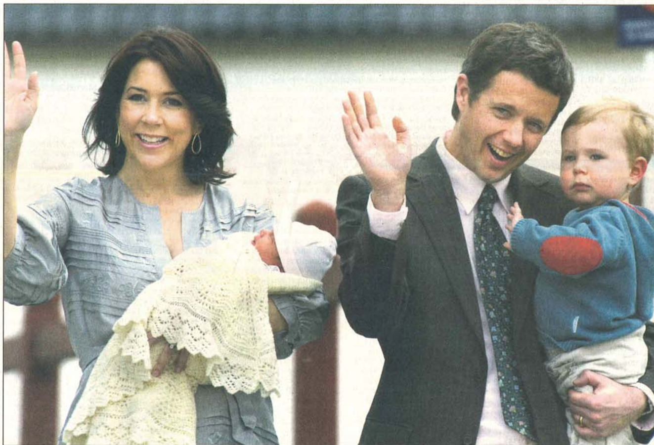
Kronprins Frederik og kronprinsesse Mary vendte i går hjem til Fredensborg Slot med deres nyfødte datter. Her præsenterer de hende sammen med storebror Christian.