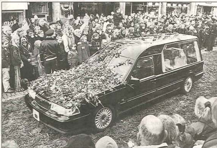
Danskerne kastede et hav af roser, for at vise Dronning Ingrid ære på den rustvogn, der bragte hendes bære det sidste stykke vej til Roskilde Domkirke.