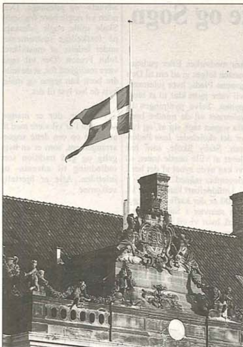
Dannebrog på Amalienborg ved Dronning Ingrid's Palæ gik tirsdag d. 7. november kl. 16.27 på halv stang. Dronningen er død.