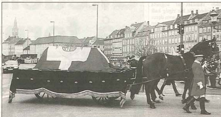
Dronningens bære blev på en hestetrukken rustvogn ført fra Christiansborg Slotskirke ned ad Strøget til Københavns Hovedbanegård.