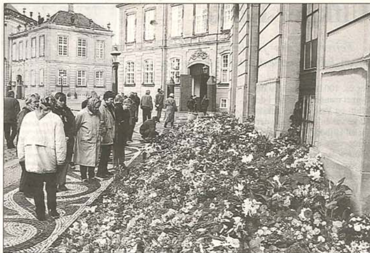
Mange tusinde viste hoffet stor respekt med et hav af blomster, hilsener og tændte lys på Amalienborg til ære for Dronning Ingrid.