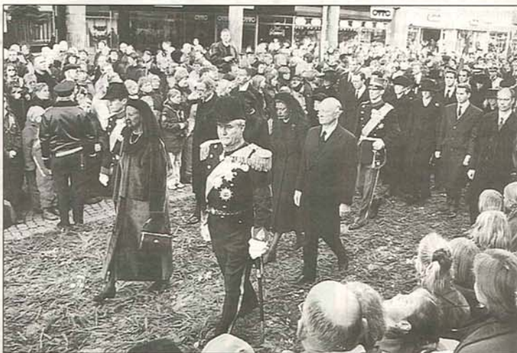
Regentparret og familie i København og Roskilde gik den tunge gang lige efter rustvognen, der bragte Dronning Ingrid ud på den sidste rejse.