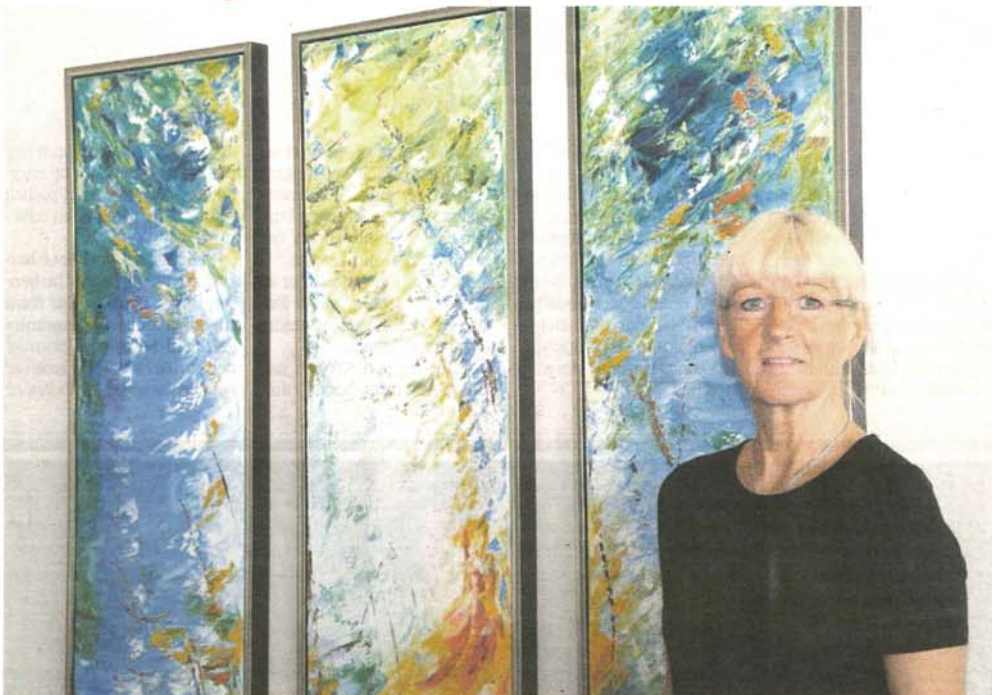
Helle Bangs billeder er inspireret af naturens former og farver.

Kunstner Helle Bang udstiller til den 10. september