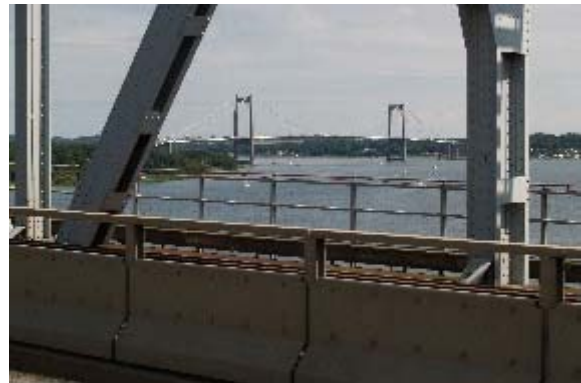
Den første trafik over den gamle Lillebæltbro. Toge, busser, biler og adskillige mennesker myldrede dengang over broen på indvielsesdagen den 14. maj 1935. I dag, 60 år senere fik jeg så muligheden for at cykle over den.