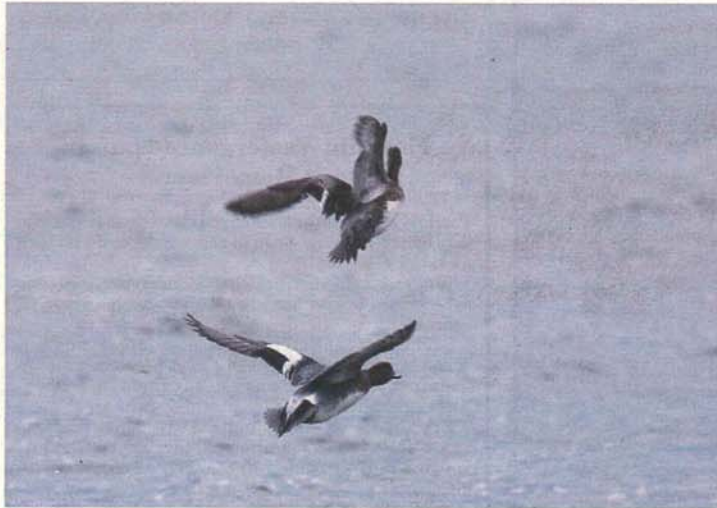
Fuglene over Voldgraven folder sig ud...

Madam Ms Madside, Lam, Laks og alt det forårs-lækre, ja tak sagde Bamsen, se side 20