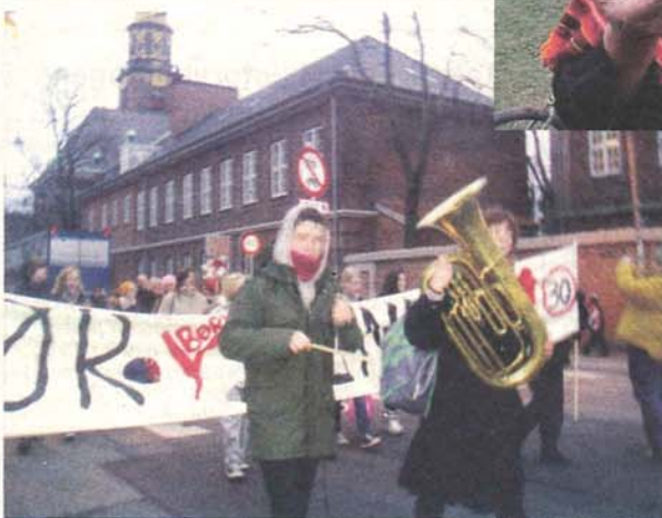
Prinsessegade - Stillevej, stor tilslutning til demo, se side 9