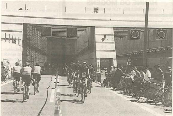
Hele dagen, fredag d. 9. juni havde mange tusinde, travlt med at cykle ned i den lange tunnel, kurs mod Sverige, for at beundre det store byggeri.