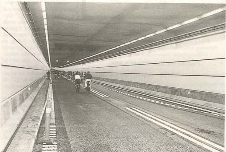
Sikkerhedsmæssigt er der ikke taget nogen chancer. Den fire kilometer lange tunnel er beklædt med brandsikker beton på indersiden, udstyret med flugtveje for hver 88 meter.

Over 40.000 mennesker indviede i pinsen Øresundsbroen på cykel, Røde Kors havde med deres Åben Bro-arrangement sørget for, at cyklisterne som de første fik lov til at komme over broen.