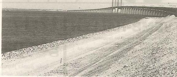
Den faste forbindelse over Øresund er åbnet, Danmark og Sverige forenet.