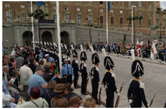
Godt en halv million svenskere valfartede til Stockholm, omkring Det Kungliga Slott og langs den maratonlange karet- og sejltur i hovedstaden.

Victorias brudebuket var en stor, løs dråbeformet buket formet over en lille kugle, der gjorde, at der kunne komme mange blomster i. Buketten bestod af traditionelle svenske, hvide sommerblomster og eksotiske blomster hentet mange steder fra i Sverige - blandt andet Ockelbo, hvorfra Daniel er født.