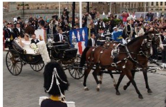
Karetturen i Stockholm fandt sted i den åbne karet, trods vejrguderne varslede byger. Vejret var overskyet, tørt med en del sol.