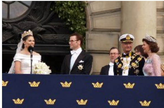
Kronprinsesse Victoria takkede sin far for, at hun nu havde fået sin drømmeprins. Hans Kongelige Højhed Prins Daniel af Sverige, Hertug af Västergötland.

Økonomichefen i det svenske kongehus regner med, at den endelige regning på brylluppet vil lyde på omkring 20 millioner danske kroner. Personaleomkostningerne blev helt klart den største udgiftspost. Der var dog ikke noget usædvanligt ved det høje beløb. Da kronprins Frederik blev gift med Mary, 14. maj 2004, kunne kongehuset senere oplyse et årsregnskab med underskud på 12,6 millioner. Dette underskud i årsregnskabet blev forklaret ved kronprinsparrets bryllup og anskaffelsen af en ny kronebil til dronningen. Altså kunne man formode, at der også dengang var tale om et bryllup i den to-cifrede millionklasse. Det royale bryllup i Sverige var det største og mest storslåede kongelige begivenhed i Europa i mange år. Godt 2300 pressefolk havde søgt akkreditering til det kongelige bryllup. De ville sørge for, at begivenheden nåede hele verden rundt.