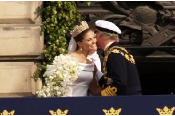
Kronprinsesse Victorias far gav sin datter et kindkys og lykønskede hende med bryllupsdagen.