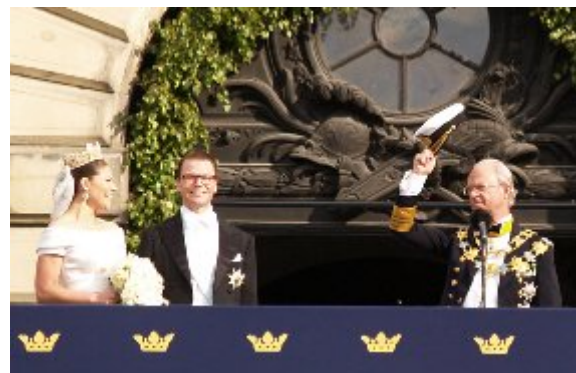
Kong Carl Gustaf udråbte et fire-foldigt leve for kronprinsesseparret, Victoria og Daniel.