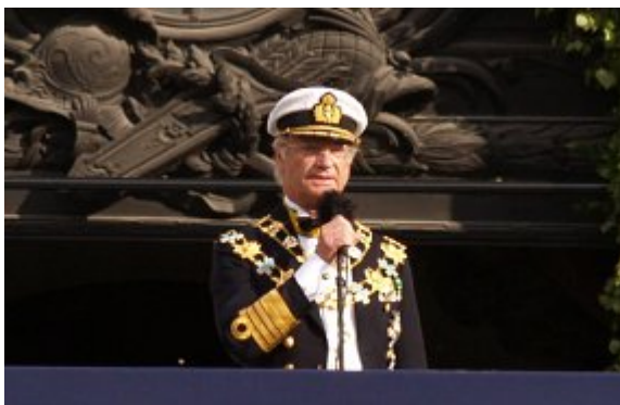
Sveriges konge, Kong Carl Gustaf talte for Stockholms borgere, bød prins Daniel velkommen.

Det kongelige bryllup i Sverige blev det svenske kongehus største dag i 34 år, da den charmerende kronprinsesse Victoria og hendes flotte forlovede, Daniel Westling gav deres ja til hinanden. De var det mest romantiske brudepar man kunne forestille sig. Derfor valfartede godt en halv million svenskere til Stockholm, ud i gaderne omkring slottet og kirken, for at få et glimt af de nygifte. Hele hovedstaden var pyntet op, alle ville fejre, at landets kommende dronning havde fundet sin drømmeprins.