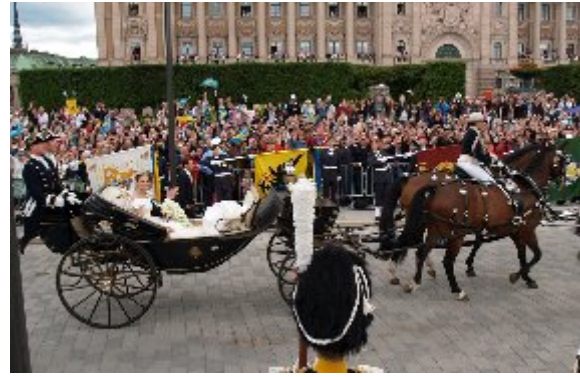
Adskillige tusinde havde taget opstilling i Stockholms gader, for at få et glimt af de nygifte.

Roturen gik rundt om Skeppsholmen og Kastellholmen, hvor det svenske forsvar salutede med 21 skud. De 18 sømænd roede parret rundt i skærgården. Sejlturen, i Kungaslupen, stoppede foran slottet, ved Logårdskajen, hvor Victoria og Daniel gik fra borde. På terrassen foran slottet blev de modtaget af alle deres nærmeste bryllupsgæster, gæsterne klappede, da brudeparret nærmede sig.