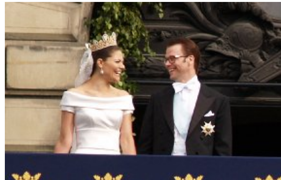
Kronprinsesse Victoria strålede af lykke, da hun sammen med Daniel kom frem for borgerne.