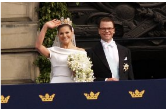
Det kongelige brudepar kom frem på Lejonbacken, ved slottet, og hilste på de fremmødte.

Victoria og Daniel dansede, lidt over midnat i slottets balsal, en fejlfri brudevals og åbnede dansegulvet.