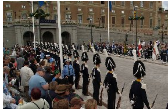
Godt en halv million svenskere valfartede til Stockholm, omkring Det Kungliga Slott og langs den maratonlange karet- og sejltur i hovedstaden.

Victorias brudebuket var en stor, løs dråbeformet buket formet over en lille kugle, der gjorde, at der kunne komme mange blomster i. Buketten bestod af traditionelle svenske, hvide sommerblomster og eksotiske blomster hentet mange steder fra i Sverige - blandt andet Ockelbo, hvorfra Daniel er født.