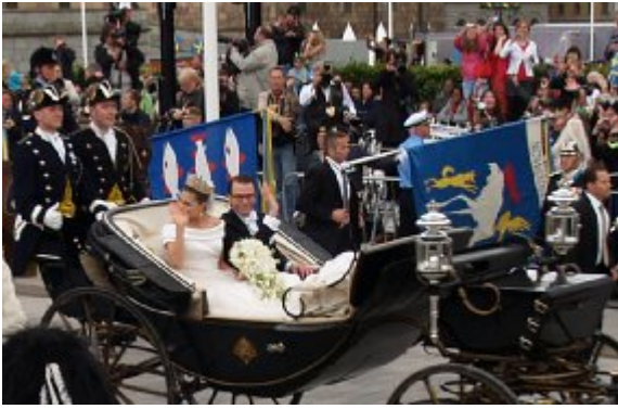
Kronprinsesseparret hilste på alle de fremmødte langs ruten. Kronprinsesse Victoria havde endeligt fået sin drømmeprins. Prins Daniel af Sverige.