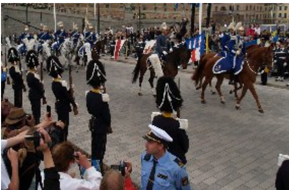
Hele den kongelige kortege strak sig over 400 meter. Hestene travede hele ruten rundt, fra Storkyrkan til Vasakajen, hvor chaluppen lå til kaj.

Victoria og Daniel steg op i kareten, fra begyndelsen af det forrige århundrede, forlod Storkyrkan og drog på tur gennem hovedstaden. Hele turen var på i alt 6,8 km, hvor selve kortegen strak sig over de 400 meter. Karetturen forløb rundt om det kongelige slot, over Nørrebro, forbi Operaen, videre hen ad Kungsträdgårdsgatan, Hamgatan, Sveavägen og Kungs Gatan, derefter ned ad Birger Jarlsgatan og Strandvägen, hvor brudeparret ved Junibacken, Vasakajen, gik ombord på Kungaslupen, Vasaorden, samme båd som også blev anvendt ved Kong Carl Gustafs og dronning Silvias bryllup i 1976. Godt 6400 personer, civile og frivillige organisationer, paraderede langs ruten, da det kongelige brudepar passerede forbi.