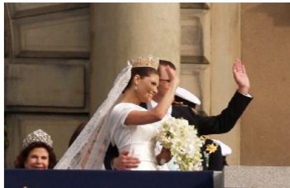
Det kongelige brudepar, kronprinsesse Victoria og prins Daniel gik fra side til side og hilste på.