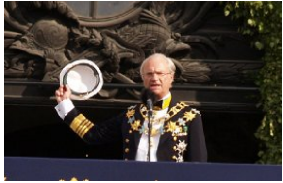
Kong Carl Gustaf svingede hatten frem og tilbage, fire gange, og markerede et fire-foldigt leve for brudeparret og sin nye prins i kongehuset.

Victoria og Daniel, det nygifte kongelige ægtepar vil bosætte sig på Haga Slott, der dog stadig er under renovering. Det er bygget i 1802 og ligger i Hagaparken lidt nord for Stockholm. Victorias far, kong Carl Gustaf af Sverige, er sammen med sine fire søstre, født og opvokset på Haga Slott.