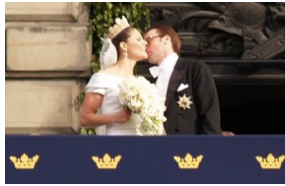
De mange tusinde Stockholmere fik hvad de var kommet for, det obligatoriske kys, der altid hører en sådan, lykkelig, begivenhed til.

Daniel Westlings nye titel blev efter vielsen i domkirken til, Hans Kongelige Højhed Prins Daniel af Sverige, Hertug af Västergötland.