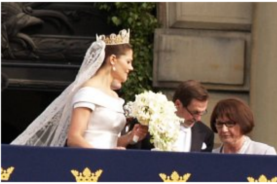
Kronprinsesse Victoria bar sin mors, dronning Silvias, brudeslør og diadem fra brylluppet, for 34 år siden med kong Carl Gustaf, den 19. juni 1976.