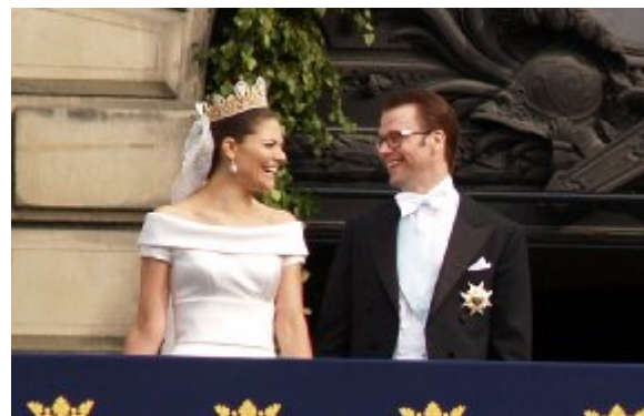
Kronprinsesse Victoria strålede af lykke, da hun sammen med Daniel kom frem for borgerne.