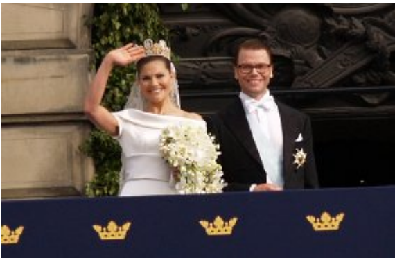
Det kongelige brudepar kom frem på Lejonbacken, ved slottet, og hilste på de fremmødte.

Victoria og Daniel dansede, lidt over midnat i slottets balsal, en fejlfri brudevals og åbnede dansegulvet.