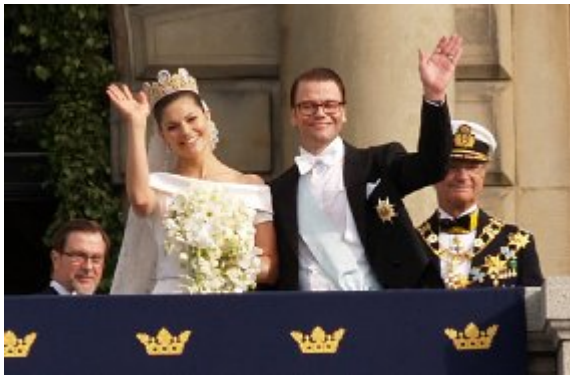
Kronprinsesse Victoria og prins Daniel modtog folkets store hyldest foran Det Kungliga Slott i Stockholm og vinkede stolt af glæde tilbage til de fremmødte.