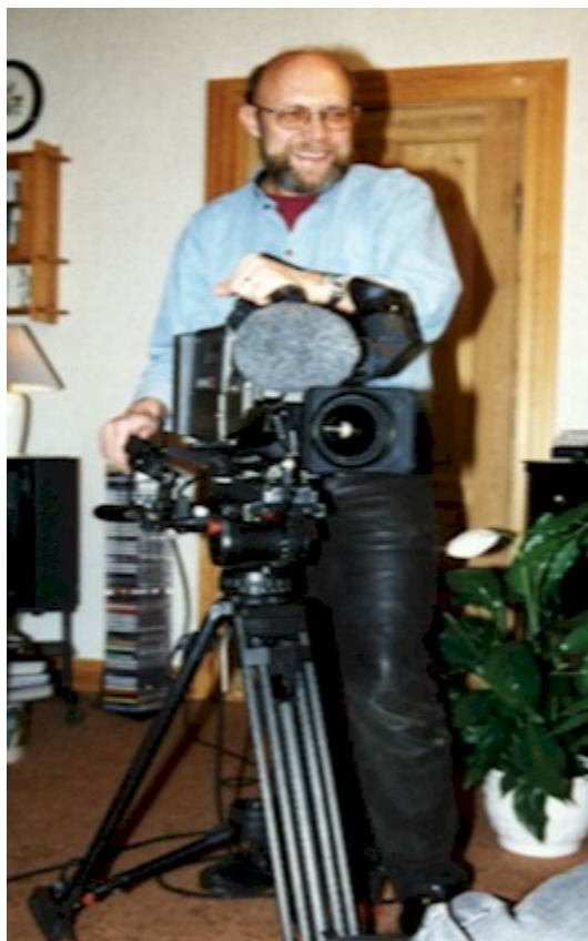
Filmholdet fra TV/Midtvest i Holstebro på besøg under optagelserne til udsendelsen med seernes egne billeder. Majestættens jubilæum 25 år.