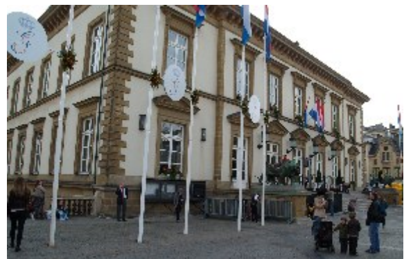
På rådhuset, Hôtel de Ville, fandt den borgerlige vielse, fredag den 19. oktober klokken 15.30 sted. Arvestorhertug Guillaume og Stéphanie de Lannoy spadserede tilbage til Storhertugpaladset.