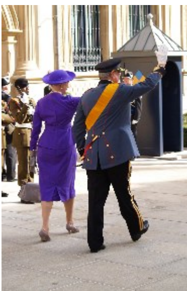
Det danske regentpar dronning Margrethe og prinsgemal Henrik.

Fra de tre nordiske lande mødte kongefamilierne talrigt op ved brylluppet i Luxembourg. Forbindelsen mellem de tre nordiske og det luxembourgske kongehus er tæt. Fra Danmark deltog dronning Margrethe og prins Henrik sammen med kronprins Frederik og kronprinsesse Mary. Fra Sverige deltog kun dronning Silvia, kronprinsesse Victoria og prins Daniel, mens hele den norske kongefamilie, kong Harald og dronning Sonja samt kronprins Haakon og kronprinsesse Mette-Marit mødte op.