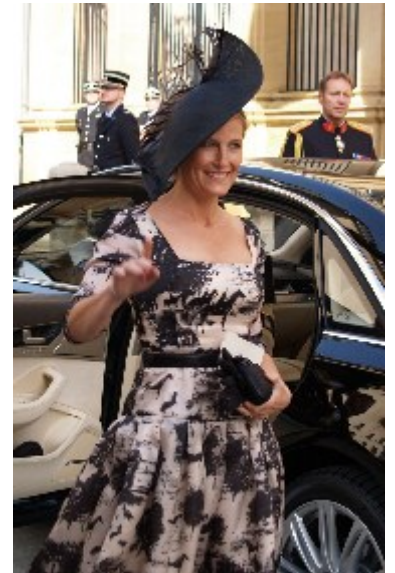
Storbritannien var repræsenteret af grevinde Sophie af Wessex og prins Edward.

Eftermiddagens største begivenhed var den helt store balkonscene fra Storhertugpaladset i midtbyen, hvor adskillige tusinde var mødt op, for at få et glimt af de nygifte. Hele den nærmeste kongefamilie trådte sammen med brudeparret ud på balkonen og hilste på folket, hvorefter de på slottet bød deres gæster velkommen til en reception.