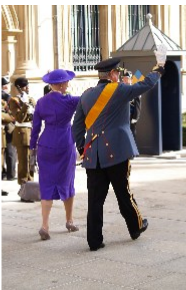
Det danske regentpar dronning Margrethe og prinsgemal Henrik.

Fra de tre nordiske lande mødte kongefamilierne talrigt op ved brylluppet i Luxembourg. Forbindelsen mellem de tre nordiske og det luxembourgske kongehus er tæt. Fra Danmark deltog dronning Margrethe og prins Henrik sammen med kronprins Frederik og kronprinsesse Mary. Fra Sverige deltog kun dronning Silvia, kronprinsesse Victoria og prins Daniel, mens hele den norske kongefamilie, kong Harald og dronning Sonja samt kronprins Haakon og kronprinsesse Mette-Marit mødte op.