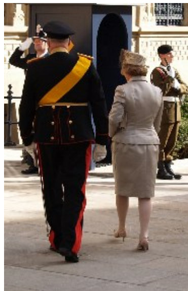
Norges konge Harald og dronning Sonja på vej ind til receptionen på paladset i centrum.