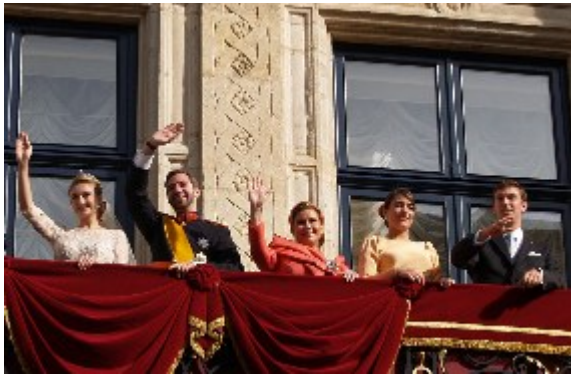
Efter brudeparrets optræden på balkonen trådte den nærmeste familie samlet ud. Arvestorhertug-brudeparret, storhertuginde Maria Teresa, gommens søster Alexandra og bror Sébastien.