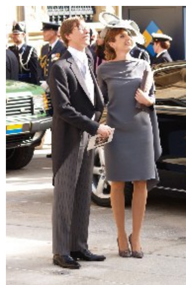
Guillaumes bror prins Louis og hans hustru, prinsesse Tessy.