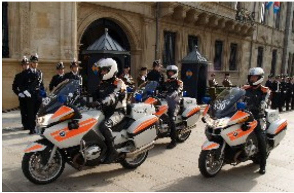
Det luxembourgske politi eskorterede de kongelige gæster fra slot til Cathédrale Notre-Dame, hvor den kirkelige handling fandt sted og tilbage igen.