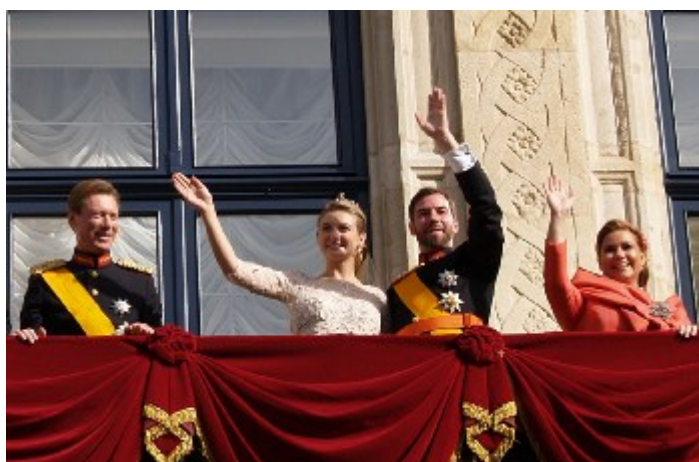
Det luxembourgske regentpar, storhertug Henri og storhertuginde Maria Teresa. I midten, dagens brudepar, arvestorhertug Guillaume og Stéphanie de Lonny.