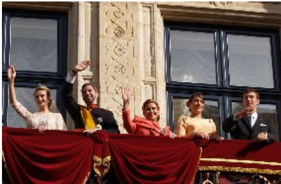
Efter brudeparrets optræden på balkonen trådte den nærmeste familie samlet ud. Arvestorhertug-brudeparret, storhertuginde Maria Teresa, gommens søster Alexandra og bror Sébastien.