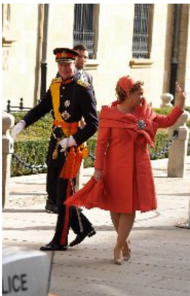
Brudgommens forældre, storhertug Henri og storhertuginde Maria Teresa, der bar en helt orangefarvet frakkekjole.