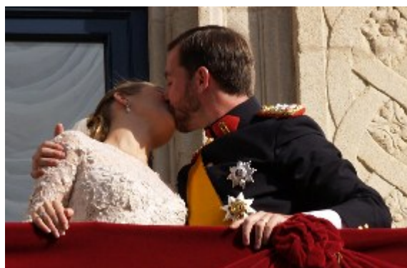
Et af balkonscenens største højdepunkter var selvfølgelig det obligatoriske kys folket ventede på. Brudeparret kyssede fem gange.