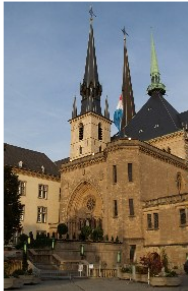
Hertugdømmets katedral, Cathédrale Notre-Dame de Luxembourg, hvor vielsen fandt sted.