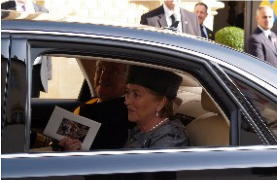
Det belgiske regentpar, dronning Paola og kong Albert, var også klar til fest.