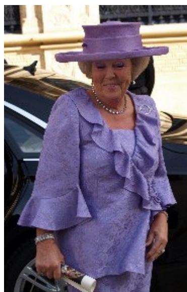
Dronning Beatrix fra Holland.