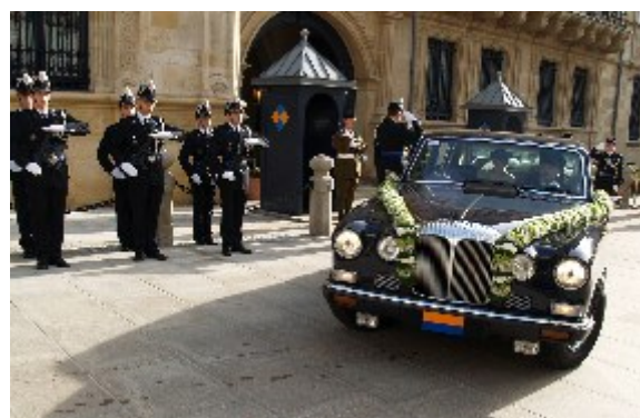
Arvestorhertug Guillaume ventede stolt i den historiske katedral på sin kommende frue Stéphanie, der forlod paladset i den sorte blomsterpyntede vogn, der også kørte de nygifte tilbage igen efter vielsen.