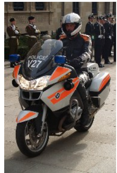
Politiet holdt ro og orden hele dagen i Luxembourg. Mange var valfartet ud på gaderne for at få et glimt af de kongelige.

Det britiske kongehus repræsenterede sig med deltagelse af prins Edward og Sophie. De er ikke uvante med bryllup- per i de europæiske kongehuse. Sammen har de også deltaget ved kongelige vielser i henholdsvis Monaco, Norge, Sverige og da kronprinsesse Mary og kronprins Frederik blev gift den 14. maj 2004 i Københavns Domkirke.