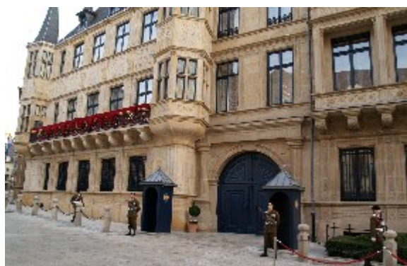
Storhertugpaladset, The grand-ducal palace, i Luxembourg centrum, dannede fredag den 19. og lørdag den 20. oktober 2012 rammen om det royale bryllup i det luxembourgske kongehus.