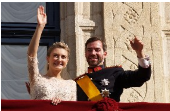
Det kongelige brudepar høstede absolut folkets hyldest, da de trådte ud på balkonen. Gaden på godt 100 meter, foran paladset, mellem paladset og rådhuspladsen, var tætpakket af borgere.

Min flyrejse til Luxembourg blev en ekstra oplevelse i sig selv, da kronprins Frederik og kronprinsesse Mary fredag eftermiddag, 19. oktober klokken 15.30, steg på det samme fly. Hjemrejsen søndag den 21. okt. klokken 10.30 fik vi selskab af kronprins Haakon fra Norge, og igen kronparret fra Danmark. Lidt kongeligt har man da lov at være.