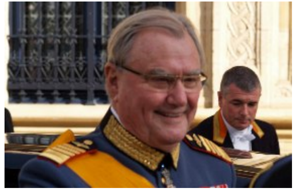
Efter 45 års ægteskab blomstrede kærligheden stadig mellem prins Henrik og dronning Margrethe, da de mødte op til storarveheretugbrylluppet.