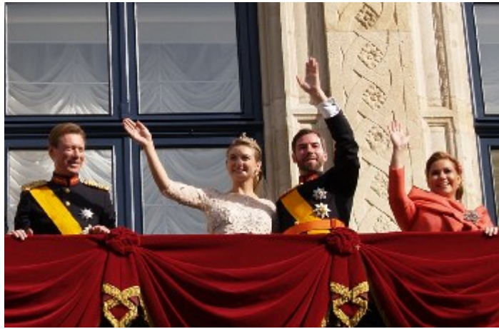
Det luxembourgske regentpar, storhertug Henri og storhertuginde Maria Teresa. I midten, dagens brudepar, arvestorhertug Guillaume og Stéphanie de Lonny.