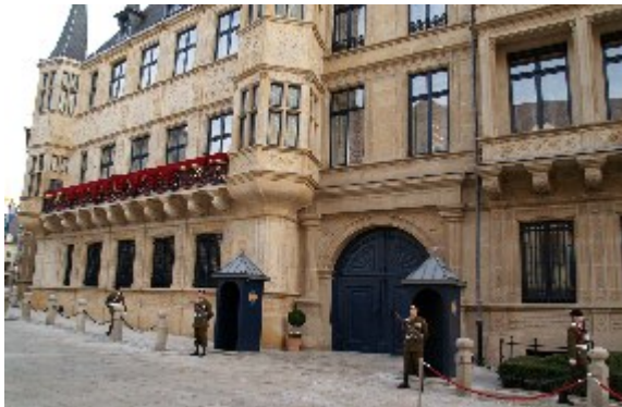
Storhertugpaladset, The grand-ducal palace, i Luxembourg centrum, dannede fredag den 19. og lørdag den 20. oktober 2012 rammen om det royale bryllup i det luxembourgske kongehus.