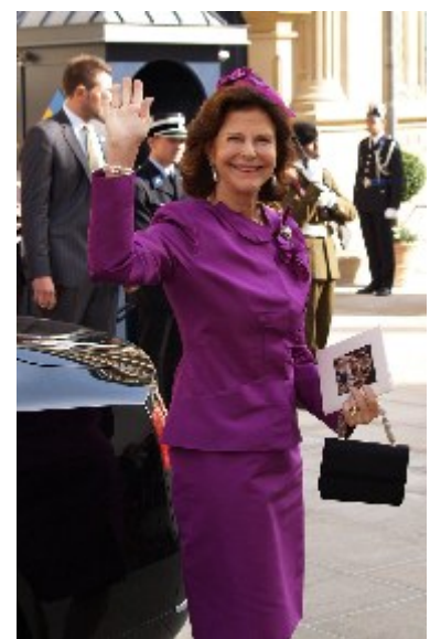
Dronning Silvia fra Sverige mødte op uden sin gemal Kong Carl XVI Gustaf.