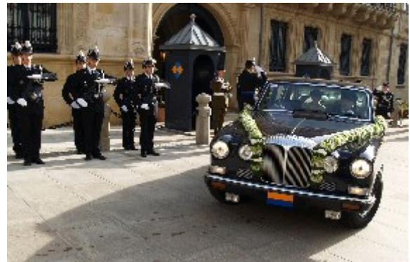
Arvestorhertug Guillaume ventede stolt i den historiske katedral på sin kommende frue Stéphanie, der forlod paladset i den sorte blomsterpyntede vogn, der også kørte de nygifte tilbage igen efter vielsen.