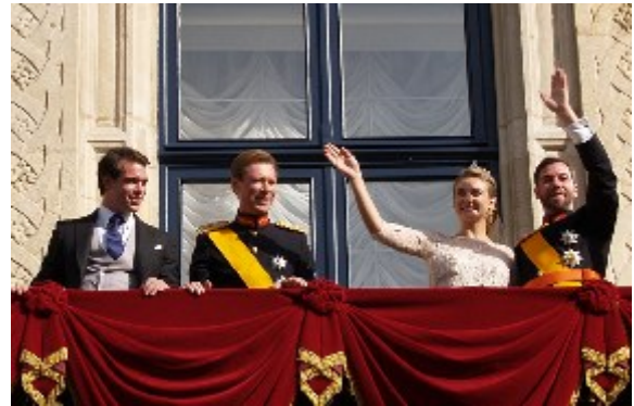
Fra venstre endnu en af Guillaume's brødre, prins Felix, gommens far, storhertug Henri og de stolte nygifte, Stéphanie og Guillaume.

Forholdet mellem Guillaume og Stéphanie har været holdt hemmeligt i lang tid. De havde kendt hinanden i flere år, så det var først i november sidste år, at storhertugarvingen afslørede, at han havde en kæreste. Prins Guillaume er den ældste søn af storhertug Henri og hertuginde Maria Teresa. Storhertuginde Maria Teresa af Luxembourg født i 1955 giftede sig i 1981 med Storhertug Henri af Luxembourg.