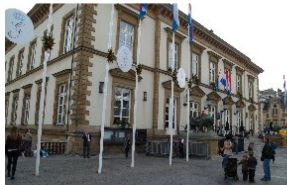
På rådhuset, Hôtel de Ville, fandt den borgerlige vielse, fredag den 19. oktober klokken 15.30 sted. Arvestorhertug Guillaume og Stéphanie de Lannoy spadserede tilbage til Storhertugpaladset.