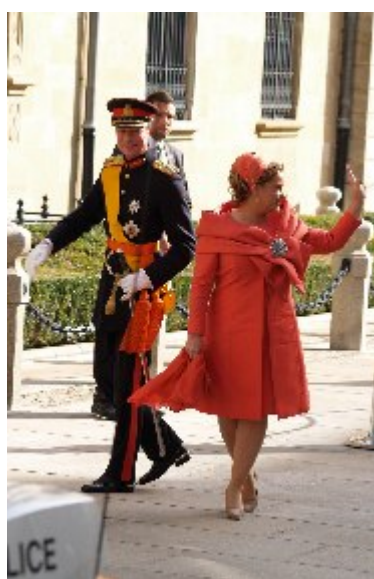
Brudgommens forældre, storhertug Henri og storhertuginde Maria Teresa, der bar en helt orangefarvet frakkekjole.