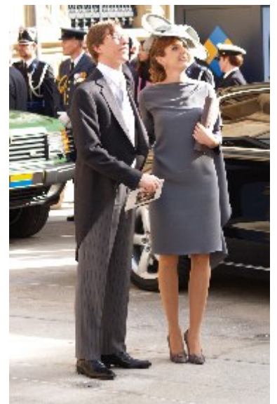
Guillaumes bror prins Louis og hans hustru, prinsesse Tessy.