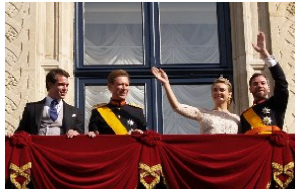
Fra venstre endnu en af Guillaume's brødre, prins Felix, gommens far, storhertug Henri og de stolte nygifte, Stéphanie og Guillaume.

Forholdet mellem Guillaume og Stéphanie har været holdt hemmeligt i lang tid. De havde kendt hinanden i flere år, så det var først i november sidste år, at storhertugarvingen afslørede, at han havde en kæreste. Prins Guillaume er den ældste søn af storhertug Henri og hertuginde Maria Teresa. Storhertuginde Maria Teresa af Luxembourg født i 1955 giftede sig i 1981 med Storhertug Henri af Luxembourg.