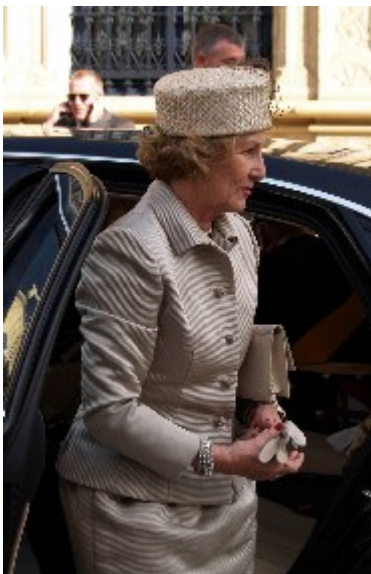
Dronning Sonja fra Norge var iklædt nudefarve fra top til tå og var klar til den store fest.