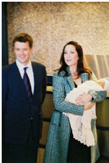
De stolte nybagte forældre viste stolt deres lille søn, Prins til Danmark, frem til de mange fremmødte.