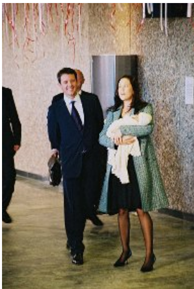
Kronprins Frederik og kronprinsesse Mary kom ned i forhallen klokken 14.30 tirsdag d. 18. oktober.