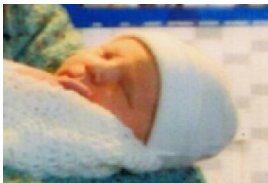
Danmarks lille tronarving, kommende konge, født på Rigshospitalet, 15. oktober 2005 kl. 01.57, målte 51 cm lang og vejede i alt 3500 gram.