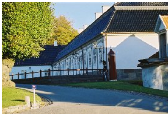
Kronprins Frederik satte sig bag rattet i bilen og satte kursen direkte hjem mod Kancellihuset i Fredensborg, ved Fredensborg Slot i Nordsjælland.