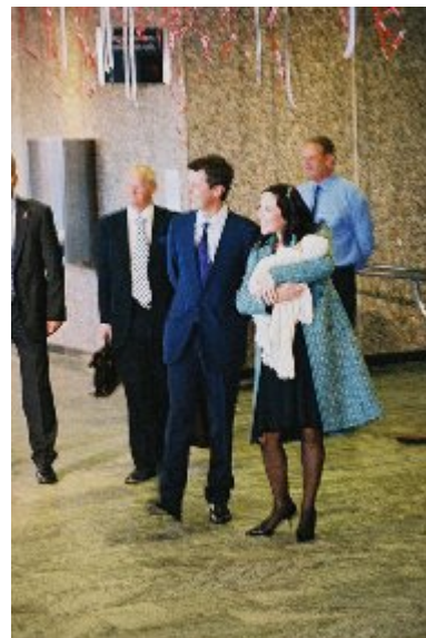
Mary fortalte ved mødet med pressen i Rigshospitalets forhal, at den lille prins skal være storebror.