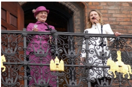
Dagens jubilar, dronning Margrethe og Københavns overborgmester Sophie Hæstorp Andersen viste sig kun én enkelt gang på den berømte balkon.