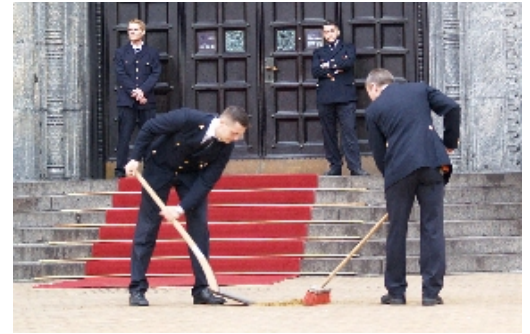
Københavns kommunes folk havde travlt med at holde hestepærerne væk fra indgangen til rådhuset. Der var ryddet pænt op omkring hele bygningen i Hovedstaden.