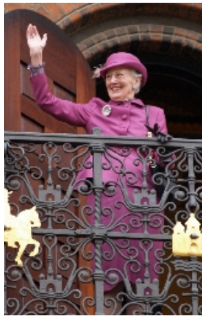
Dagens største højdepunkt var, da dronningen trådte ud på rådhusbalkonen, ud mod de mange fremmodte på Rådhuspladsen.