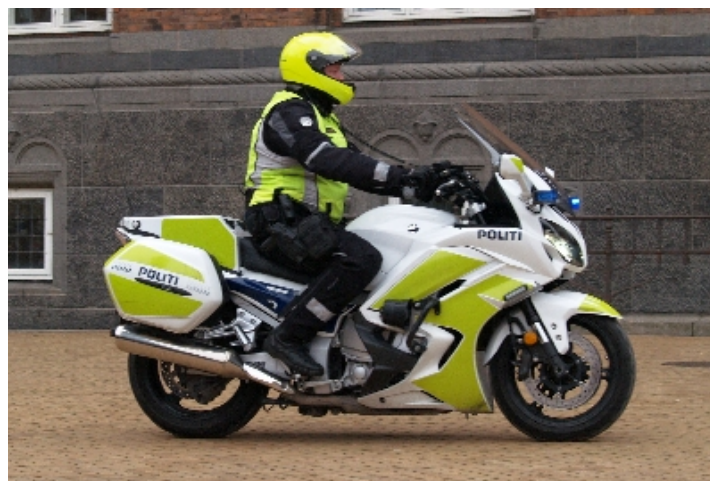
Politiet holdt ro og orden under afviklingen af dronningens regeringsjubilæum, den lørdag eftermiddag på Rådhuspladsen. De ledsagede de kongelige korteger frem og tilbage under majestæten's festivitater i København.

Dronningen smilede og var rørt over den varme velkomst, der blev vist majestæten, da alle de kongelige gæster gjorde deres éntre på Rådhuspladsen. Danskerne viste dronning Margrethe, at man sætter enorm stor pris på den kongelige familie, også i vanskelige tider. Hele kongefamilien tog sig god tid til at få det hele med ved ankomsten til Rådhuset. Rådhuspladsen var til den royale fest i hovedstaden fyldt til bristepunktet, og stemningen var ligeså god, som den er, når der er modtagelse af danske sportstjerner, der vender hjem efter deres store og flotte sportspræstationer.