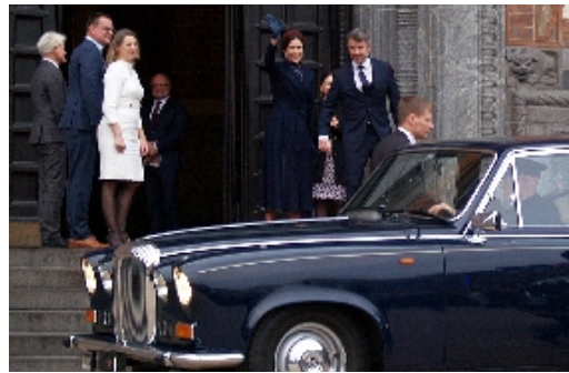
Efter Margrethe, i kongehusets Krone 1, forlod så også kronprinsparret, Frederik og Mary festlighederne fra Københavns Rådhus.