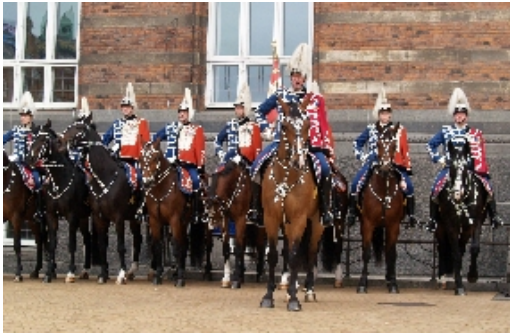
Hele Gardehusarregimentets Hesteskadron eskorterede dronningen, dagens jubilar, fra Amalienborg til Rådhuspladsen.