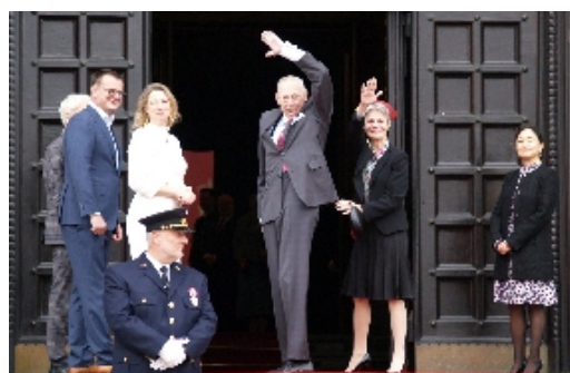
Dronningens fætter, grev Ingolf af Rosenborg og hans hustru, grevinde Sussie af Rosenborg, deltog også i festlighederne på rådhuset.