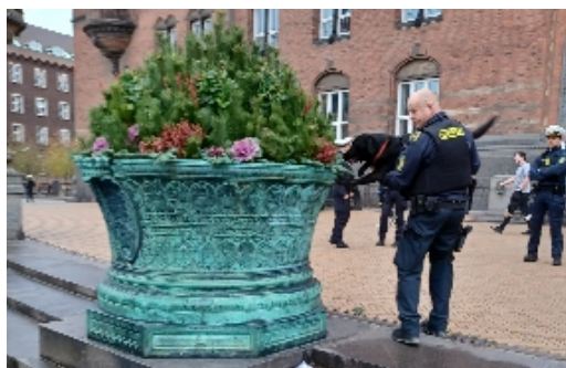
Politiet havde lørdag formiddag travlt med at tjekke alt omkring Københavns Rådhus, inden dagens store festivitas skulle finde sted. Indenfor på Rådhuset blev der også tjekket for bomber.

På trods af den barske behandling fra majestæten bakker prins Joachim og prinsesse Marie dog fortsat op om kongehuset.