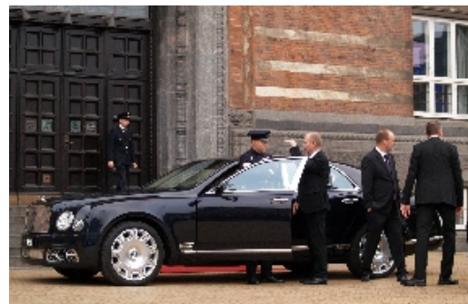
Kongehusets kronebiler var efter hele seancen i rådhushallen, klar til at køre alle de kongelige gæster hjem til Amalienborg Slot igen.