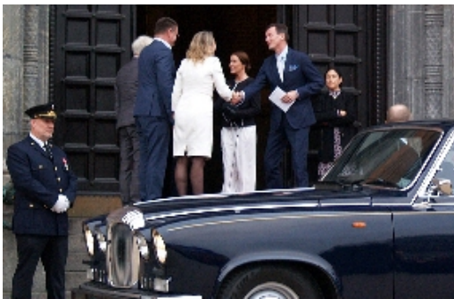
Prins Joachim og prinsesse Marie tog pænt afsked med overborgmesteren, efter det store royale besøg i rådhushallen.