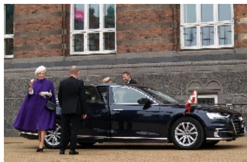
Margrethes søster, prinsesse Benedikte var denne gang ikklædt et flot, smart lilla frakkeslag af danske Wichmann Couture, som hun bar første gang ved dronningens jubilæumsfejring, på Christiansborg Slot, i januar 2022.