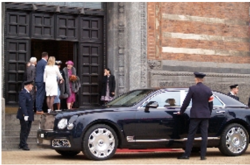
Dronning Margrethe, dagens hovedperson, var den allerførste der, klokken 15.00, forlod Københavns Rådhus igen, i Krone 121.