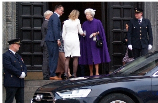
Prinsesse Benedikte takkede af og forlod den festlige frokost i rådhushallen.